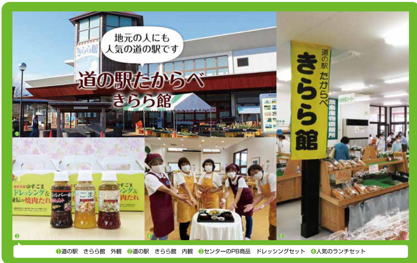
①道の駅 たらべ きらら館 外観 ②道の駅 たらべ きらら館 内観 ③センターのPB商品 ドレッシングセット ④人気のランチセット