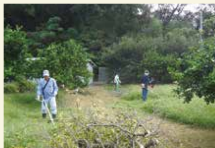
タンカン農家支援