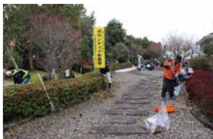
地域社会への貢献とシルバー事業の普及啓発を兼ねたボランティア活動