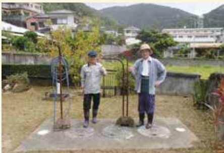
理事長・副理事長共に現場へ

瀬戸内町シルバー人材センターは、平成30年12月に設立した、会員数62名の3年に満たない弱小センターです。会員の皆さんが率先して新規会員の勧誘に動いて頂いています。顧客の満足とリピーターを確保するためには、親切丁寧な業務が必至であるとの共通理解の下、手熟(奄美の方言で「手慣れている」の意)のある皆様が会員の勧誘に奔走しており、お陰様で少しずつではありますが、新規会員が増えております。