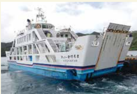
フェリーかけろま

スタート間もないセンターならではの工夫が、庭木の剪定や草刈り業務への拘りです。発注者にご満足頂ける仕上がりになる様に、会員同士で仕上げ具合のチェックを行い、少数精鋭ならではの絶妙のコンビネーションで、会員相互に得意分野を生かすチームワークに徹しています。