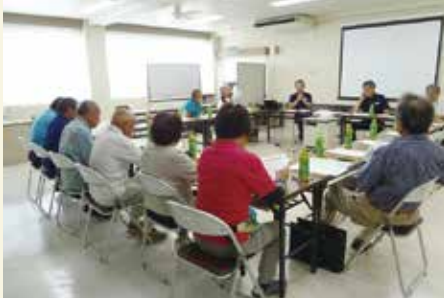
会員意見交換・勉強会