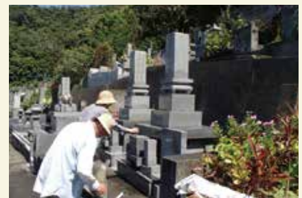
墓守も増えています

これからも地道な活動を続け、地域の皆様に長く愛されるシルバー人材センターを目指します。