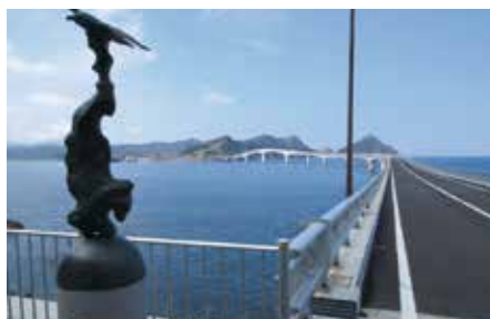
令和2年夏に開通した甌大橋(上甌～鹿島)で甌島が一体化。これに伴い2か所あった支所を1か所に集約しましたが、里から下甌まで約40kmと 広範囲

に「薩摩川内市シルバー人材センター」として発足しました。合併当時、特に海を隔てた広域合併は全国的にも珍しく、センター事業が軌道に乗るまでは困難もありました。発足後540名いた会員は、平成24年度末には376名まで減少しましたが、その後各種の取り組み等により契約金額とともに年々増加し令和2年度末には595名と持ち直したところです。今後も、人口規模にあった会員数の確保と地域に信頼されるセンターを目指します。