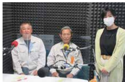
地域コミュニティFMのスタジオから生放送でシルバーのPR活動を実施