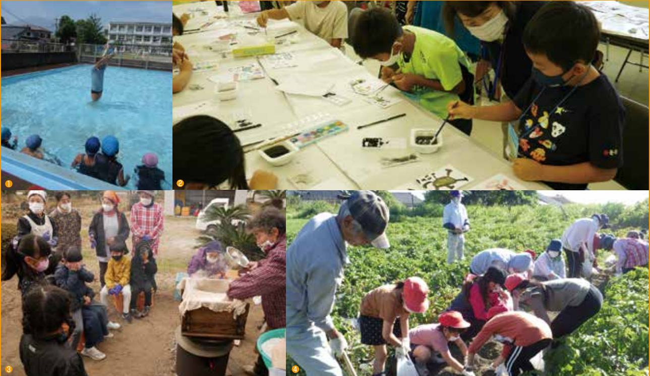
①水泳教室 ②絵手紙教室 ③もちつき大会 ④ジャガイモ収穫体験