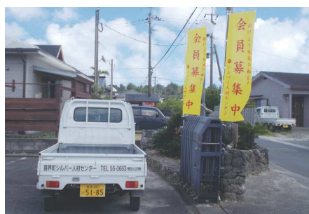
センター入口のぼり旗

一般社団法人として地域の皆様に愛され、頼られる町のセンター創りに努力していきたいと思ひます。