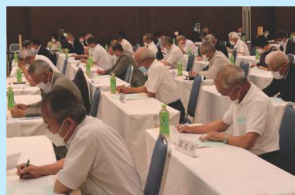
ご出席会員の皆様 30センター64名出席