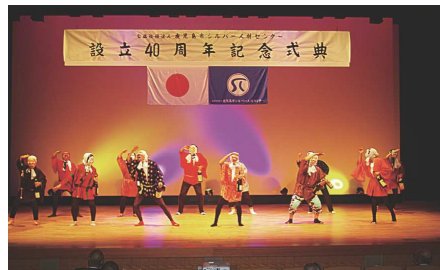
会場を盛り上げた「ひまわり劇団」