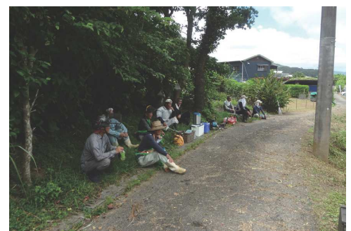
30分毎の休憩と水分補給

近年の地球温暖化に伴い、特に夏場を中心とした気温上昇の中、屋内外の作業現場においては、30分作業、10分休憩のルーティーンを徹底し、休憩時間の水分補給と塩飴等の準備により、熱中症などの体調異変の発生もゼロを継続中です。特に飴玉の常備は、会員の好みを尊重するあまり10種類を超えました。