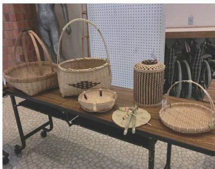
会員作品展示(竹細工)