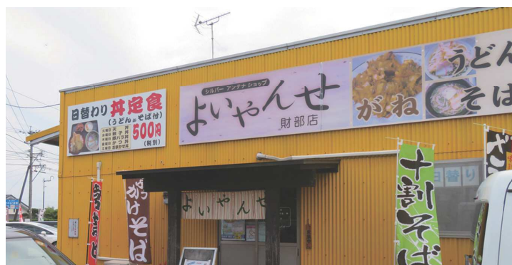
センター運営の「よいやんせ 財部店」

皆さんの前で事故・怪我をした体験談(事故の内容・改善策など)を発表しなければなりません。これは会員も嫌がりました。これがあるから事故・怪我をしたくないとの話もあります。