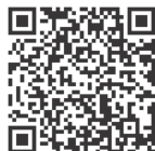
40年のあゆみの映像はこちら