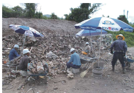
粗大ごみ分別作業