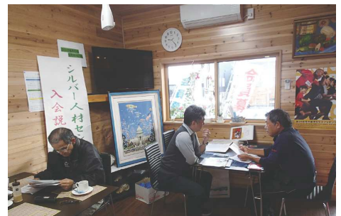
ゆらり処入会説明会