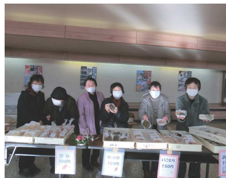
独自事業製品販売