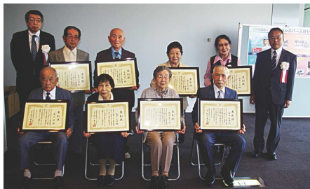
長期会員等被表彰者

開催しました。 式典では、過去の歴史を振り返る記念映像「40年の歩み」の上映や、長期会員等の表彰が行われました。また、アトラクションとして「ひまわり劇団」(福祉施設等への訪問活動グループ)による津軽三味線演奏、歌や踊りの披露があり、参加者全員が笑顔で40周年を祝い、更なる飛躍を誓いました。併せて設立40周年記念誌を発行しました。また、40周年のあゆみ、式典映像を是非ご覧ください。