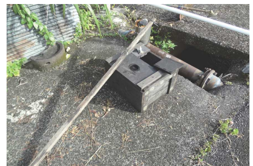
ハブ取り棒と捕獲箱の常備

また、奄美特有の毒蛇ハブ対策には、会員が所有するハブ取り棒や捕獲箱を作業現場に常備し即応体制を整えており、これまでも幾度となく出番がありました。