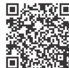
式典映像はこちら