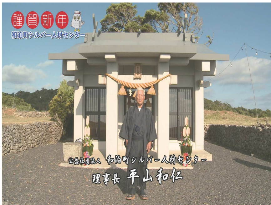
SSTV(町営有線テレビ)で映像放映

センター設立当初は、農業の町づくりを基本として、花や輸送野菜等の農作業従事者が主体であったが、近年は、企業や役所、農家、一般家庭等々からの依頼も多く10数種の職種を数えています。「今では、シルバーに頼めば！」が町民の合言葉になっています。