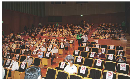
感染対策を講じた会場