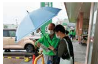
街頭キャンペーン