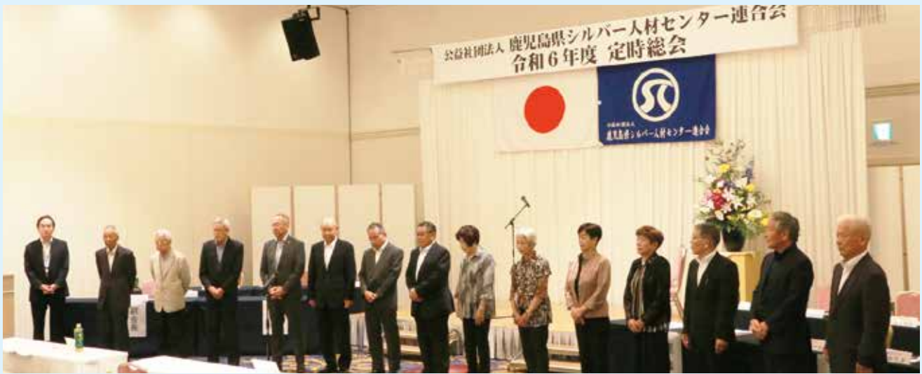
令和6年度 連合会新役員