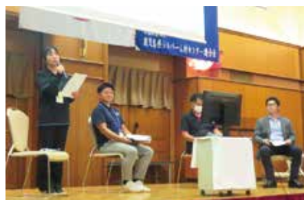
【座談会】登壇者の皆様