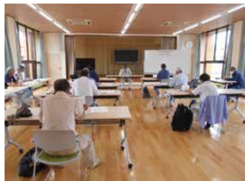
刈払機・チェーンソー安全講習会

西之表市シルバー人材センターでは、安全就業に関して、事前に発注場所や作業内容の確認を必ず行ない、高所・急斜面など危険と思われる就業場所の作業はお断りしています。また、夏場の作業は、年々熱くなってくる環境に、体は年を取っていく一方で、今までとは違ってきているという自覚が必要だと思えます。小まめな休憩と水分・塩分の補給の呼びかけはもちろんの事、体調に変化を感じたら、遠慮せずに事務所に連絡するよう伝えています。また、 西之表市は、西海岸から東海岸、山間部などへも長くても30分位で移動できるので、頻りに安全パトロールを行っています。 市街地ですと日に2~3回はパトロールできます。