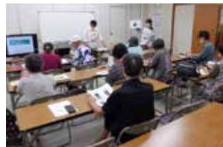
スマホ・パソコン講座