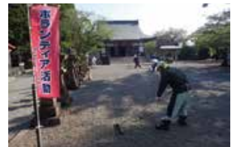
特攻慰霊祭前ボランティア活動