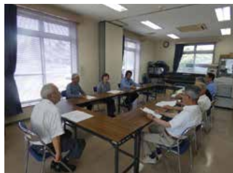
安全・適正就業対策推進委員会

また、事故が発生した場合、職群班長を交えて臨時の委員会を開催し、事故の原因、発生防止策の情報共有を行っています。