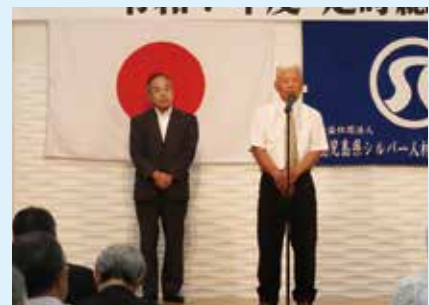
辞任理事 原会長・平山理事