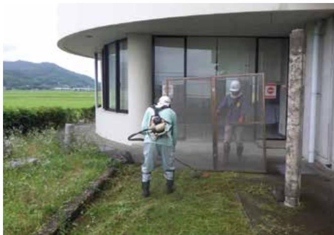
網戸を活用した飛石対策