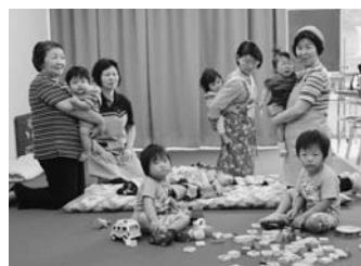
出水市シルバー人材センターが運営する「託児ルーム・ひまわり」

シルバー人材センターが新たな事業として力を入れるのはサービス分野です。特に子育てや介護を終えた女性が、自らの経験を就労の中で活かしたいと、新たな生きがいを見出し、新たな分野でも活躍したいという声があります。業務内容は調理補助、清掃洗濯の手伝い、通院付き添い、子育て支援など、就業にあたっては講習会も開催しており、資格が無くても就業可能です。また自治体では高齢単身世帯が増加し生活支援、空き家対策など課題を抱えています。これらの声にもいち早く対応