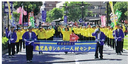
おはら祭りに参加しました!

おはら祭同好会と一般会員で毎年100人以上の踊り連で参加しています。あなたも一緒に踊りませんか。