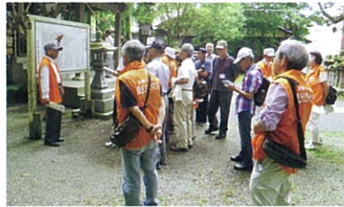
観光ガイドの研修の様子