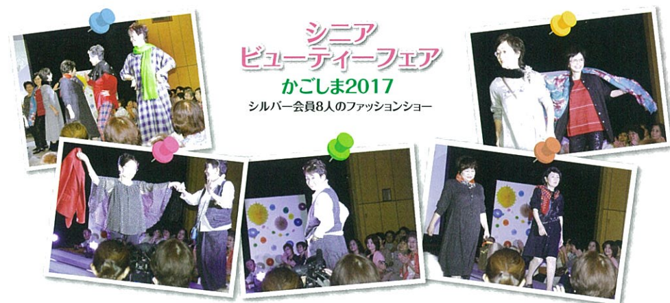
シニア ビューティーフェア かごしま2017 シルバー会員8人のファッションショー

●体も元気だからまだまだ働きたい 地域のために何かしたい ●日々の暮らしにメリハリをつけたい 新たな生きがいを見つけたい ●語り合う仲間を見つけたい 自由に使えるお金が欲しい ●そういうあなたをお待ちしております。