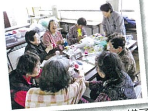
希楽会(手芸同好会)の様子