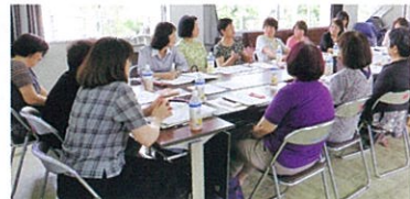
女性会員の会「ひまわりの会」の様子